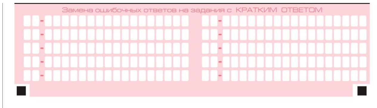
Рис. 8. Область замены ошибочных ответов на задания с кратким ответом

В нижней части бланка ответов № 1 предусмотрены поля для записи исправленных ответов на задания с кратким ответом взамен ошибочно записанных (рис. 8).